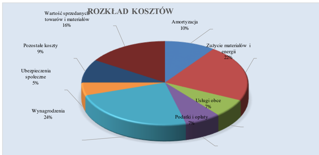
Tabela 3 Procentowy rozkład kosztów rodzajowych

Poniższe zestawienie przedstawia rodzaje oraz wysokość podatków i opłat poniesionych przez Spółkę w 2023 roku.